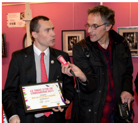
La presse assistait à la cérémonie.